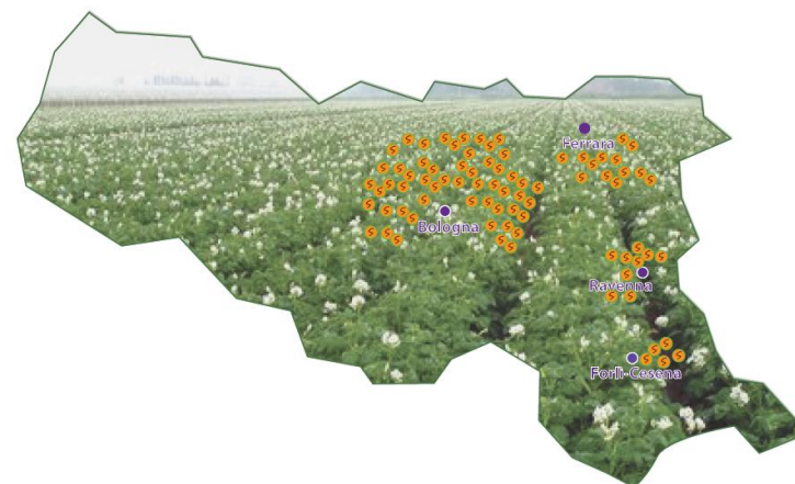
Fig. 2 - Ubicazione delle aziende coltivatrici di patate del Consorzio.

Per il Core module sono stati utilizzati dati specifici raccolti dai fornitori e soci del Consorzio Patata Italiana di Qualità. Per la fase agricola il campione è stato selezionato distinguendo tutte le aziende in base alle dimensioni e denominando "aziende piccole" quelle con una superficie < di 3 ha, "aziende medie" quelle con una superficie compresa fra 3 e 10 ha e "aziende grandi" quelle con una superficie > di 10 ha. Tutte le aziende sono ubicate nella Regione Emilia Romagna. È stato selezionato un numero di coltivatori di patate pari a 25 su circa 300 soggetti, dall'elaborazione e pesatura di tutti i dati raccolti, è stato possibile schematizzare tre tipologie di aziende denominate, appunto, "piccola", "media" e "grande". In tal modo la fase agricola risulterà rappresentativa di tutto il Consorzio poiché prende in considerazione la diversità legata alle dimensioni dei campi coltivati.